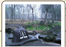
分水嶺公園 ★ 太平洋と日本海へ… 育まれて大海へ注ぎ入る 清流のロマンを感じて下さい

簡易郵便局 観光案内所 ひるがの 湿原植物園 高山市場 ソフトクリーム クレークサイド わたすげ 喫茶 分水嶺公園 W.C. たかす ファーマーズ ひるがの高原