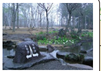
分水嶺公園 ★ 太平洋と日本海へ... 行われて大池へ注ぎ入る 清流のロマンを感じて下さい

簡易郵便局 観光案内所 ひるがの 湿原植物園 高山市場 ソフトクリーム クリックサイド わたすげ 喫茶 わたすげ ファーマーズ （乳製品） たかす ひるがの高原