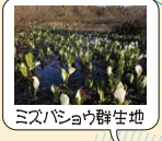
ミスバショウ群生地